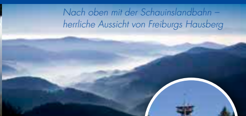
Nach oben mit der Schauinslandbahn – herrliche Aussicht von Freiburgs Hausberg